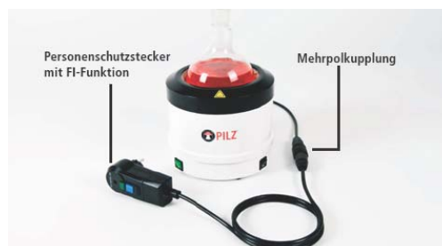
Metallgehäuse PILZ® Heizhauben (WHL-,WHR- und WHU-Serie)