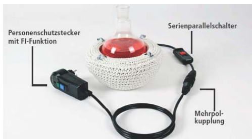
Gehäkelte PILZ® Heizhauben (WHG-Serie)

Aus diesem Grund versehen wir alle PILZ® Heizhauben mit einem in die Zuleitung eingebauten FI-Schutzschalter (30 mA).